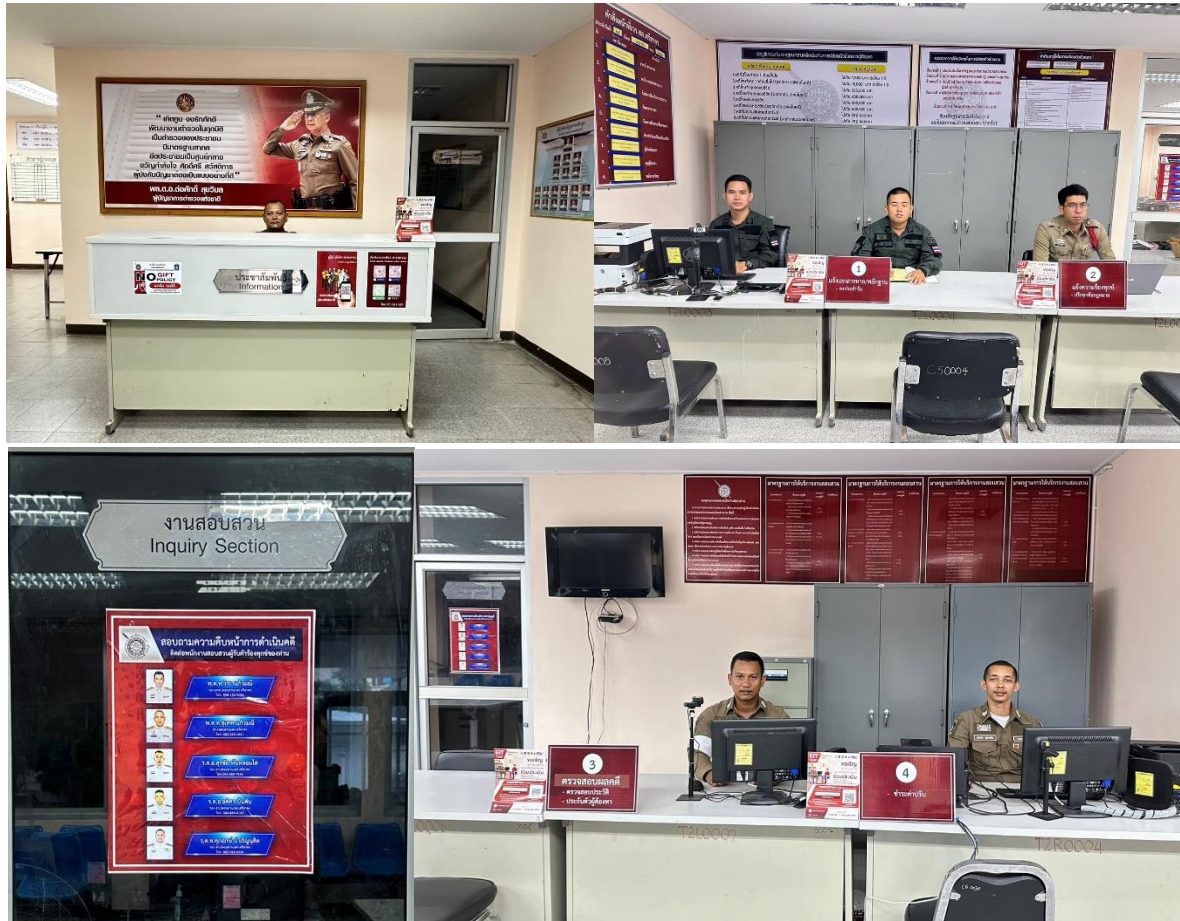
รูปถ่ายผลการดำเนินงานจริง ณ จุดบริการ ของสถานีตำรวจ